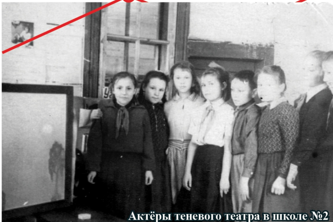
Актёры теневого театра в школе №2

В настоящее время возглавляю городской совет ветеранов комсомола, и, конечно, помня о том, что комсомол шефствует над пионерией, мы об этом не забываем.