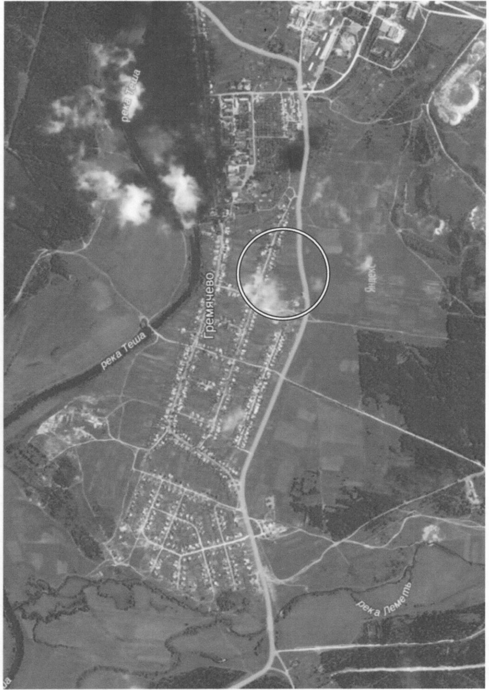
Нижегородская область, Кулебакский район, р.п. Гремячево. Ситуационный план размещения малоэтажной жилой застройки.