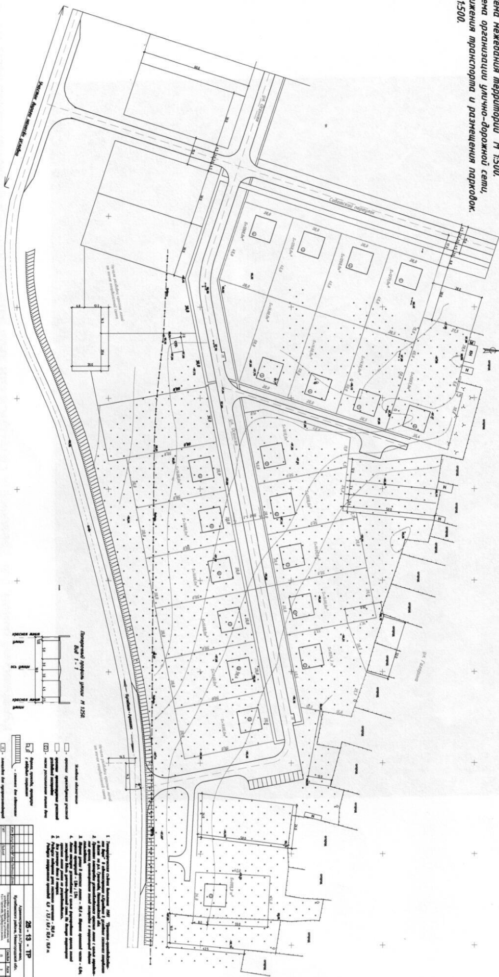
Профіль вулиці Ланцюговий майдан М 1:500 План 1-1