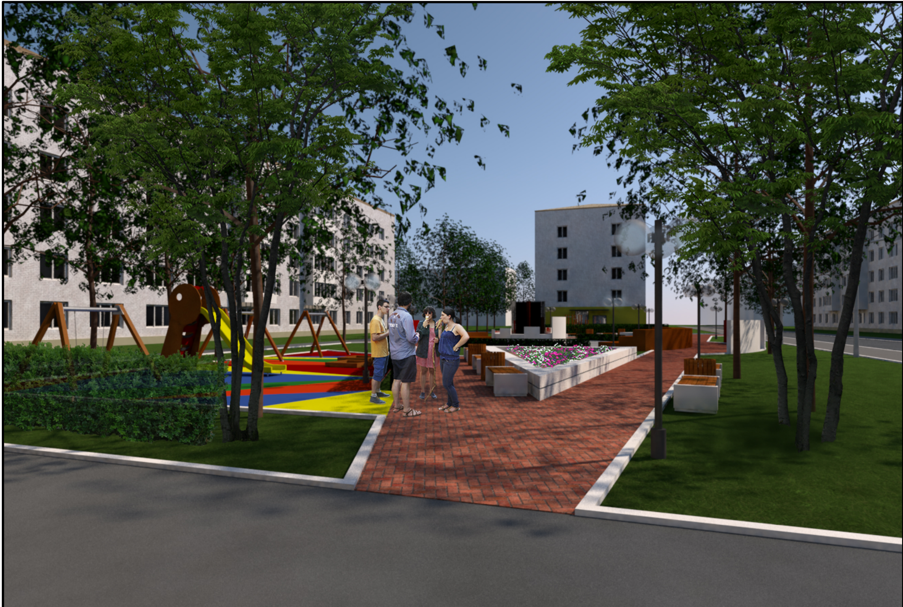
6. Визуализация. Вид на противоположный вход в сквер с зоной отдыха