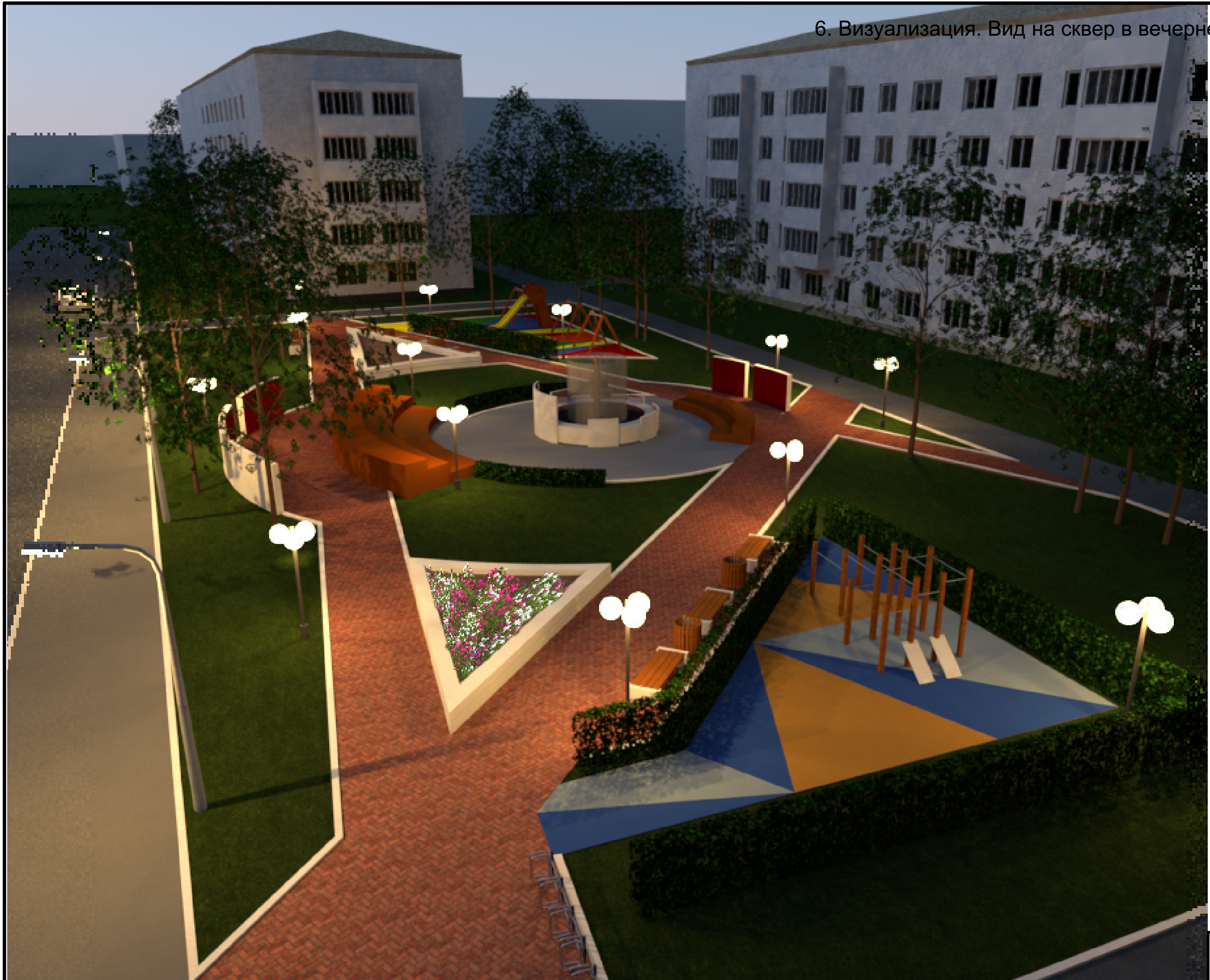
6. Визуализация. Вид на сквер в вечернее время суток