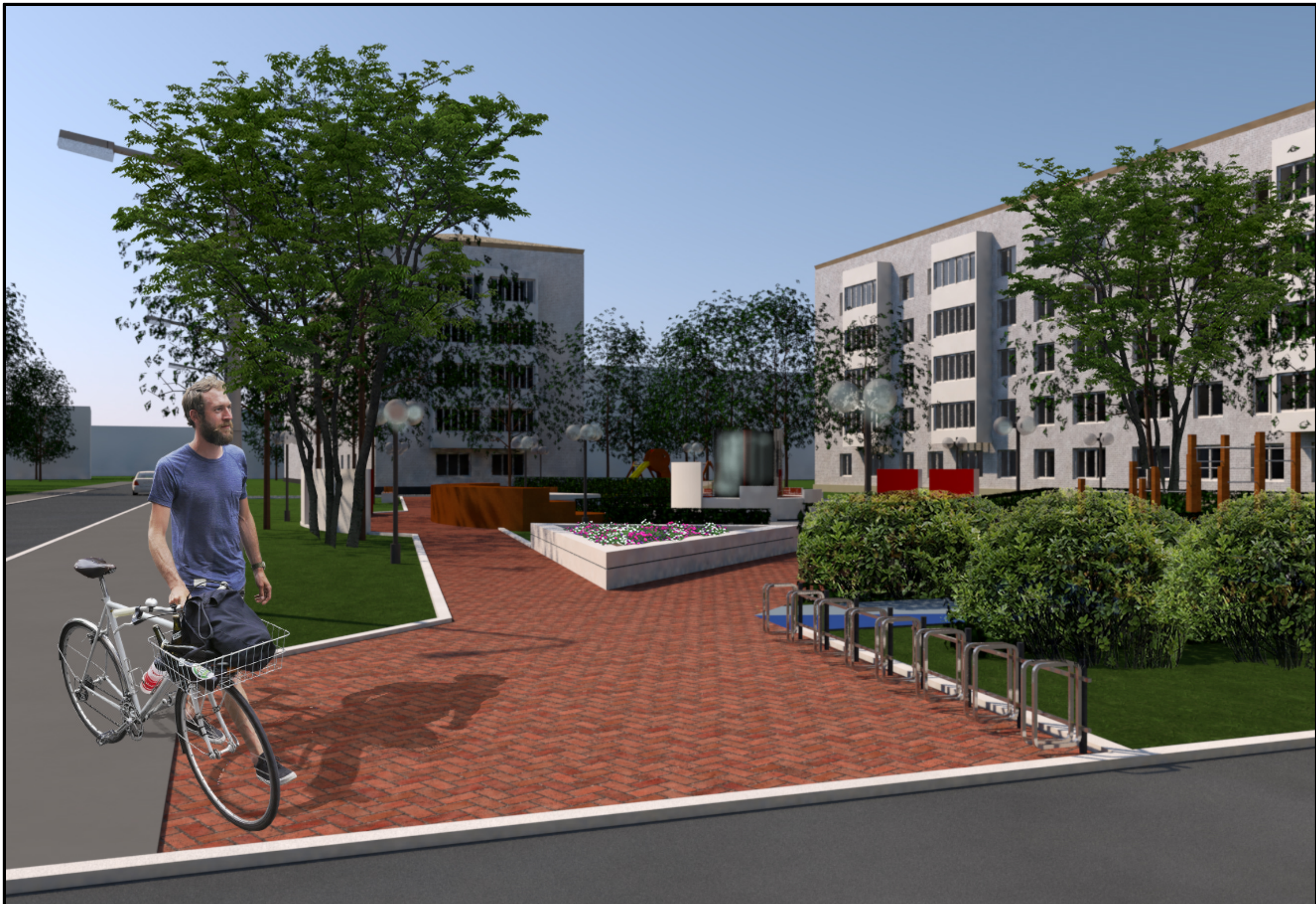
6. Визуализация. Вид на входную зону с цветочной клумбой