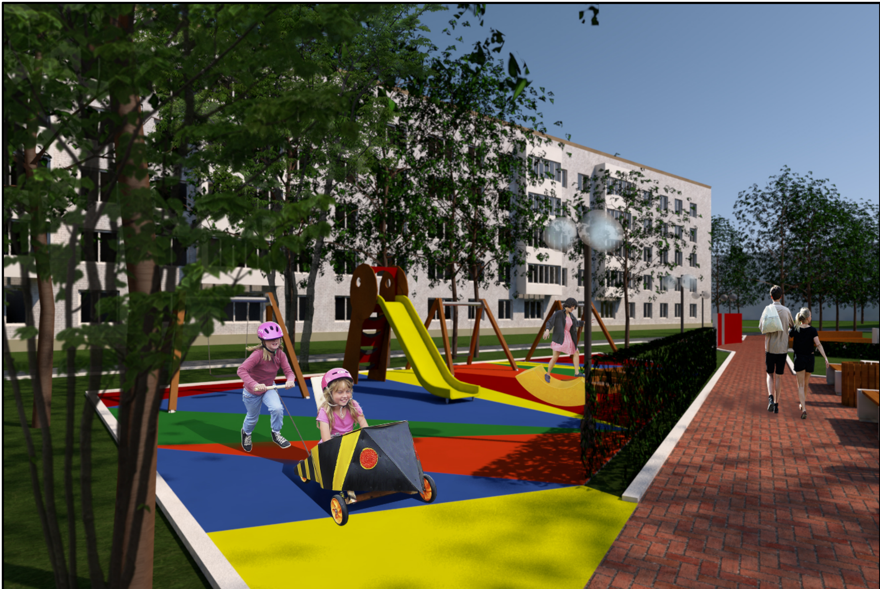
6. Визуализация. Вид на детскую- игровую площадку с качелями и горкой.