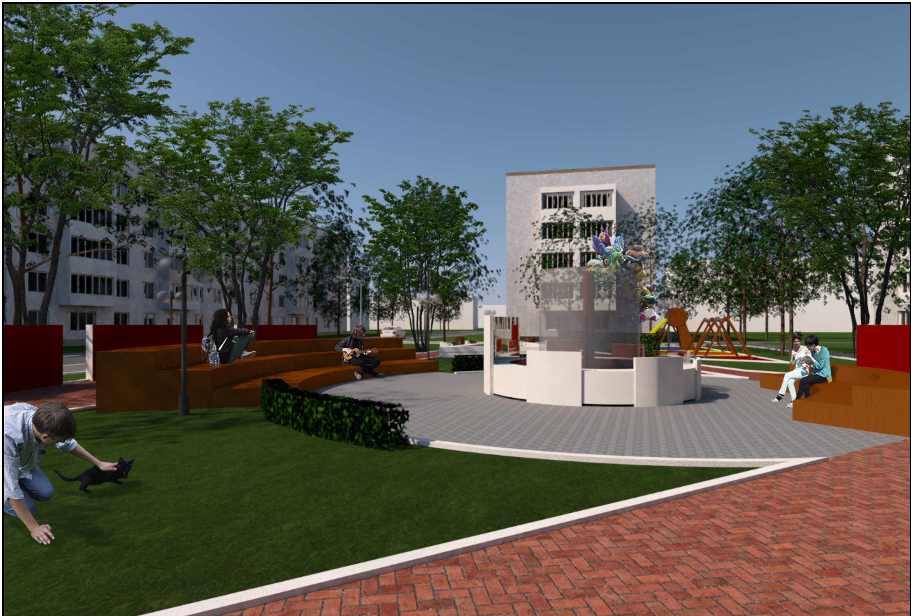
6. Визуализация Вид на фонтан и амфитеатр с зоной отдыха.