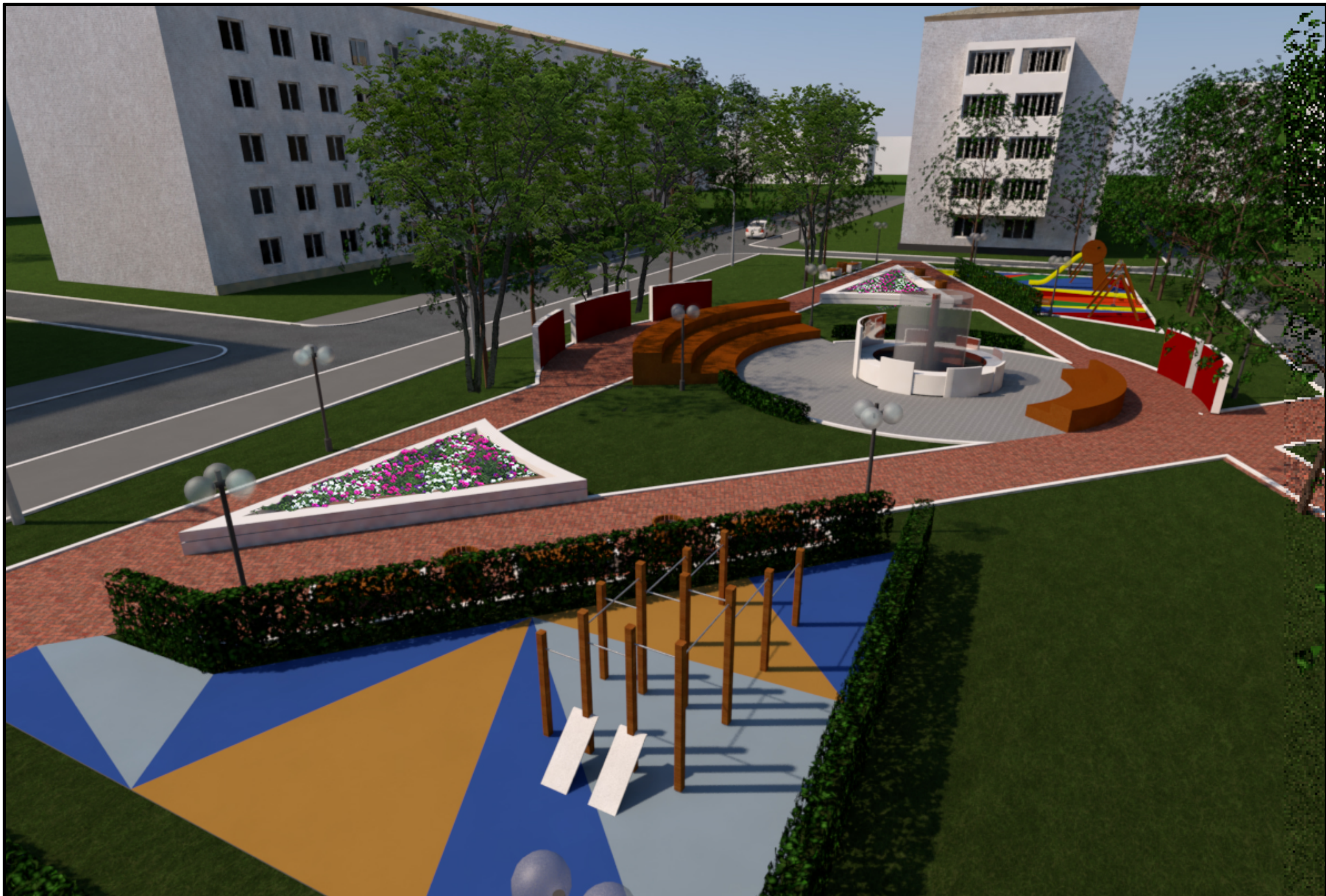
6. Визуализация. Вид сквера с верхних этажей жилого дома