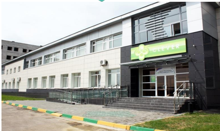
Бизнес-инкубатор «Clever» (S: 3688 кв.м.)