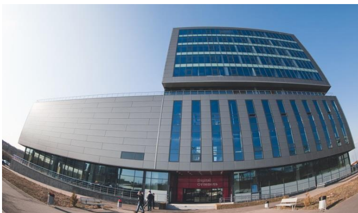
Бизнес-центр Технопарка (S: 12079 кв.м.)