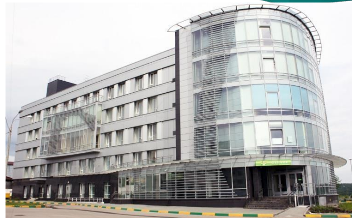
Бизнес-инкубатор Технопарка (S: 5400 кв.м.)