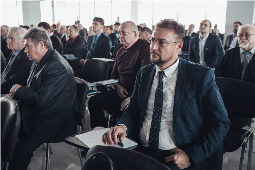
Технопарк «Анкудиновка» с инновационной экосистемой